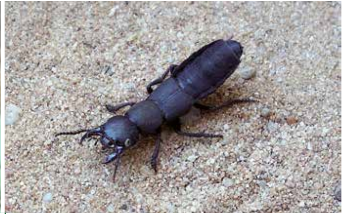
Un « diable » : le Staphylin noir Ocypus olens (30 mm)

voler que très rarement, contrairement aux autres cicindèles qui chassent au vol le jour, a atterri deux fois par nuit noire près de ma lampe UV au 4 e étage. Les grands staphylinins, ceux qui ont été surnommés « diables » en raison de leur posture d'attaque, sont bien présents, en tête les 2 plus grandes espèces de la plaine d'Alsace, le Staphylin noir Ocypus olens et O. ophthalmicus . À proximité immédiate du jardin botanique, un exemplaire de ce dernier a même mordu et arrosé de sa sécrétion anale corrosive un collègue qui essayait de le capturer pour me le confier. Sans entrer dans les détails, les très nombreux petits prédateurs du jardin botanique sont essentiellement des Carabidés, des Staphylinidés et des Coccinellidés.