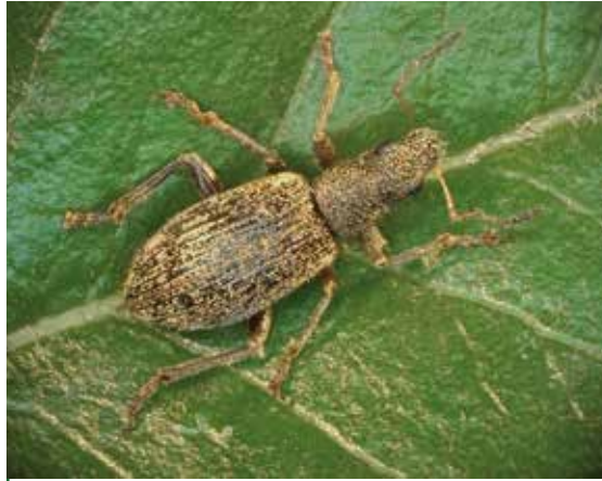
Polydrusus inustus (5 mm)