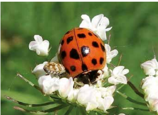
Coccinelle asiatique (6 mm) accompagnée d'un Anthrène bigarré des tapis

Il faut distinguer entre des espèces envahissantes (« invasive » en anglais) et les espèces méridionales tendant à étendre leur aire de répartition vers le nord. Les premières sont extra-européennes et se sont acclimatées chez nous au hasard de leurs points de débarquement puis se sont répandues de façon incon-