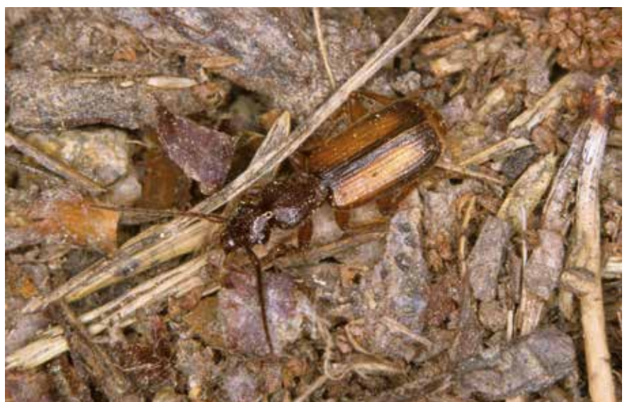
Polistichus connexus (9 mm)