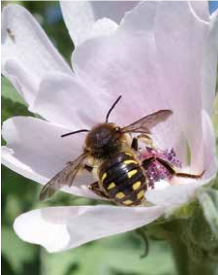
Une Anthidie (Hym. Mégachilidé)