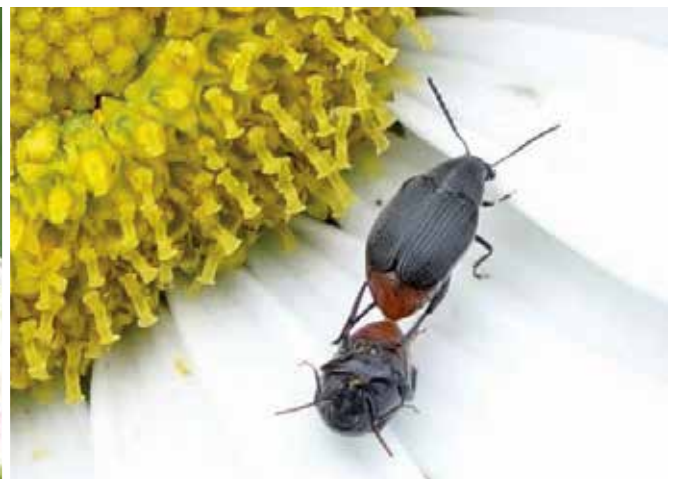
Accouplement de la bruche exotique Bruchidius siliquastris (3 mm)