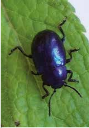
Chrysomèle bleuâtre (9 mm)