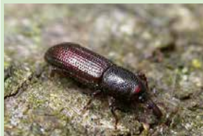
Pentarthrum huttoni