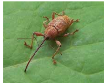
Balanin des châtaignes (17 mm, rostre compris)

était une grande rareté en Alsace, connu par une seule donnée assez ancienne. Cet insecte en limite nord de répartition est bien établi au jardin botanique où il a été pris à 5 reprises. D'autres insectes plus discrets observés au cours de l'inventaire sont soit nouveaux pour la faune de France ( Dirrhagofarsus attenuatus , Eucnémidé ; Ebaeus battonii , Malachiidé), soit pour la faune régionale (par exemple Hype-