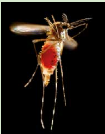
Femelle d' Aedes aegypti prenant son envol après un repas de sang

EN ÉPINGLE - voir les autres Épingles à www7.inra.fr/opie-insectes/epingle17htm