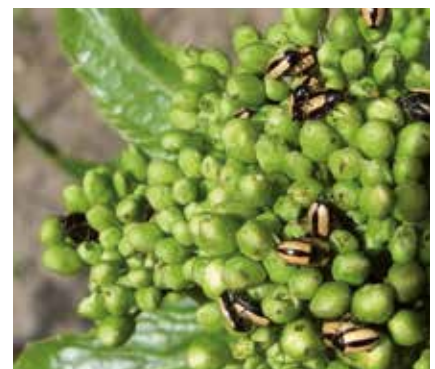
Altise du raifort (4 mm)

de données ? Les Drilidés sont des prédateurs d'escargots aux femelles larviformes, assez proches des Lamprodila (« vers-luisants »). En Alsace comme plus à l'ouest, le Drile jaunâtre Drilus flavescens , répandu de l'ouest de l'Europe centrale à l'Espagne, est le plus commun alors qu'il dépasse à peine le bassin du Rhin à l'est. Au contraire la seconde espèce régionale, Drilus concolor , centre- et est-européen, est plus rare et, pour la France, à part deux captures isolées