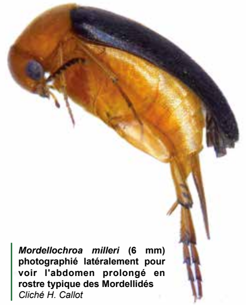
Mordellochroa milleri (6 mm) photographié latéralement pour voir l'abdomen prolongé en rostre typique des Mordellidés

sur la frange est, n'est pris régulièrement qu'en Alsace. Pour ne rien faire comme les autres, c'est cette dernière espèce qui est seule présente au jardin botanique où elle n'est pas rare. En résumé, dans le cas des Drididés, l'Alsace montre un peuplement atlantique, le jardin botanique un peuplement centre-européen.