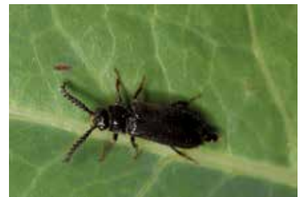
Drilus concolor (6 mm)

notables ou la modestie de l'étang et de ses berges limitent les populations d'insectes de zones humides. Enfin, la collecte ayant été délibérément peu poussée, il peut y avoir un biais méthodologique important. Ce côté tronqué de l'entomofaune crée non seulement des lacunes, mais aussi des distorsions par rapport à la faune régionale. Les 2 exemples qui suivent l'illustreront. Le genre Stenus (Staphylinidés ; 2 500 espèces de Stenus décrites, le plus grand genre du monde animal !) appartient à la plus négligée des familles de Coléoptères – mais la plus importante en nombre d'espèces. Il est cependant connu car son faciès est amusant avec ses gros yeux et sa langue extensible qui représente une adaptation remarquablement utile pour ces petits prédateurs, de ce point de vue une miniature de caméléon. On compte 63 espèces en Alsace contre 6 au jardin botanique ce qui est bien peu. Une grande majorité des espèces de Stenus fréquente des milieux humides à détremés alors que celles observées au jardin botanique sont typiques de prés, voire de milieux plutôt secs, comme Stenus ater . Alors que de nombreux insectes ripicoles ont été observés, en général attiré par l'UV, les Stenus volent peu et il est difficile de savoir ce qui, de la rareté réelle ou des méthodes de collecte, est responsable du petit nombre