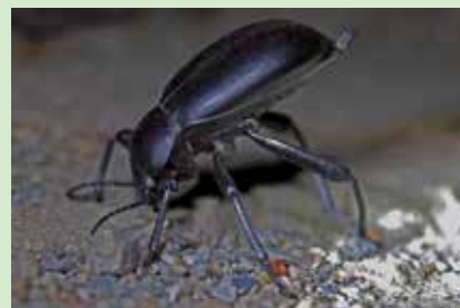
Scarabée funèbre – Cliché Thomas Brown, licence CC BY 2.0