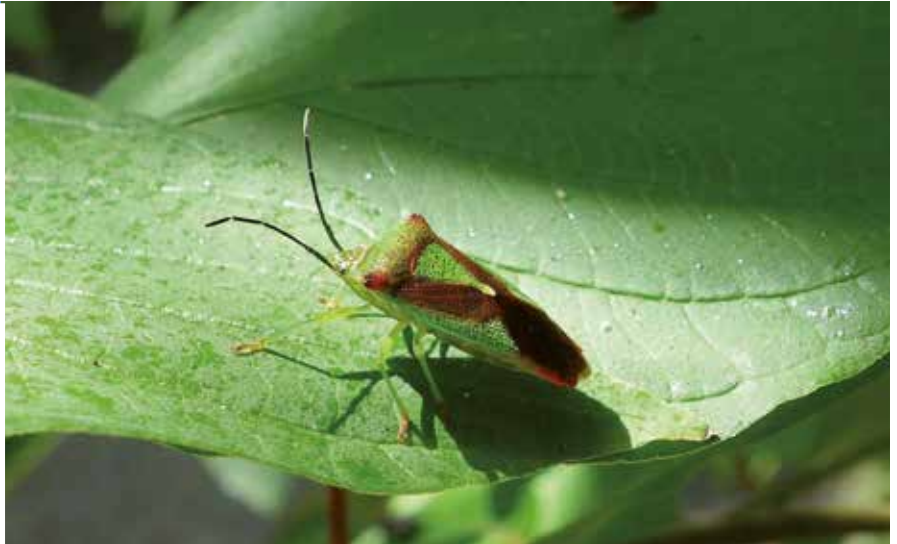
La plus grande punaise du jardin botanique, la Punaise de l'aubépine Acanthosoma haemorrhoidale (Hém. Acanthosomatidé)

des graines des Gleditsia américains comme asiatiques et de celles de Gymnocladus canadensis , le « chicot du Canada ».