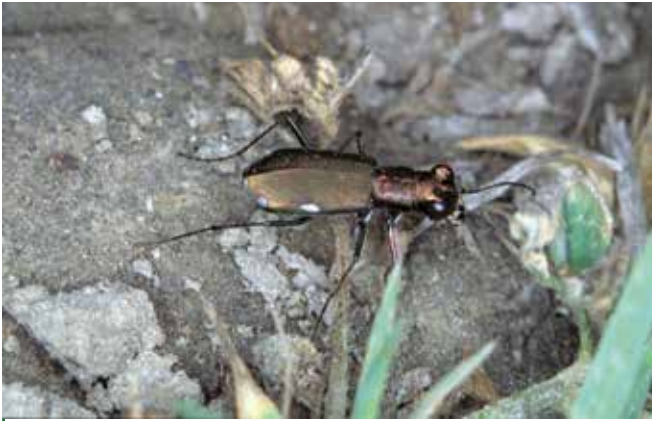
Cicindèle germanique (10 mm)