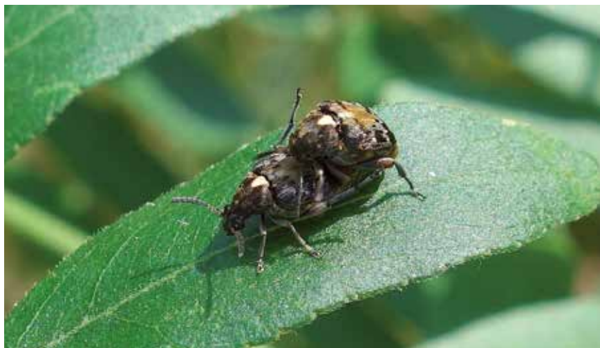
Accouplement de Megabruchidius dorsalis (6 mm)

dis , la Coccinelle asiatique. Elle y est abondante comme dans toute la région. Cependant, contrairement à une idée reçue, le Sud-Est asiatique n'est pas la seule source des arrivants récents au jardin botanique et à sa périphérie urbaine et pour 10 espèces qui en sont originaires on compte 5 américaines, 4 australiennes et 1 africaine. Deux arrivants asiatiques récents, des bruches