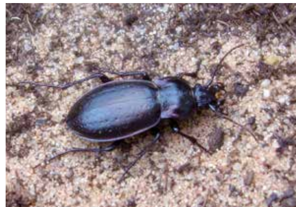
Le Carabe des bois (25 mm), le seul carabe urbain à Strasbourg