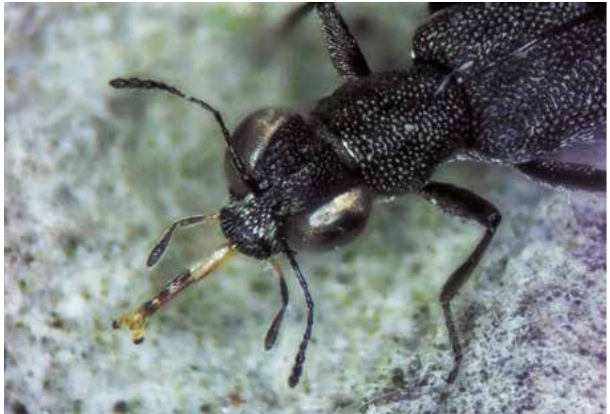
Stenus ater (5 mm) dont la langue extensible, rappelant celle des caméléons, est ici à demi-sortie

baeus albifrons , Malachiidé ; Neobisnius lathroboides , Staphylinidé ; Synchita mediolanensis , Zopheridé ; Leiopus femoratus , Cerambycidé ; la Larme noire Nyctaeus meridionalis , Eucinetidé), soit ont une réputation de rareté comme par exemple Trichocele memnonia (Dasytidé), Rhopalocerus rondanii (Zopheridé), Lathropus sepicola (Laemophloeidé) ou Teredus cylindricus (Bothriideridé).